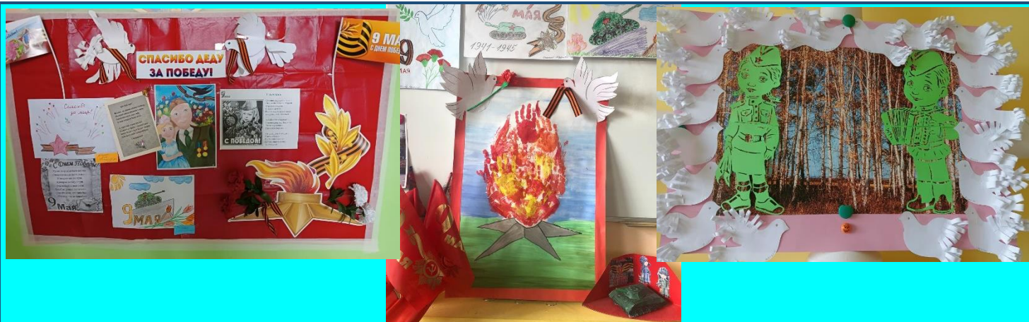
Принимали участие во Всероссийской акции «Окна Победы».