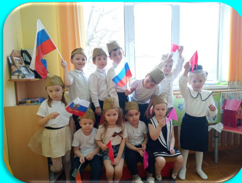
Организована выставка рисунков и поделок на военную тематику.