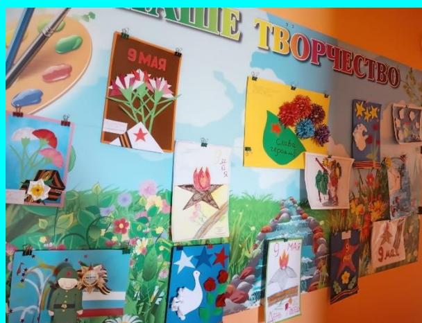
Оформлены стенгазеты в групповых комнатах.