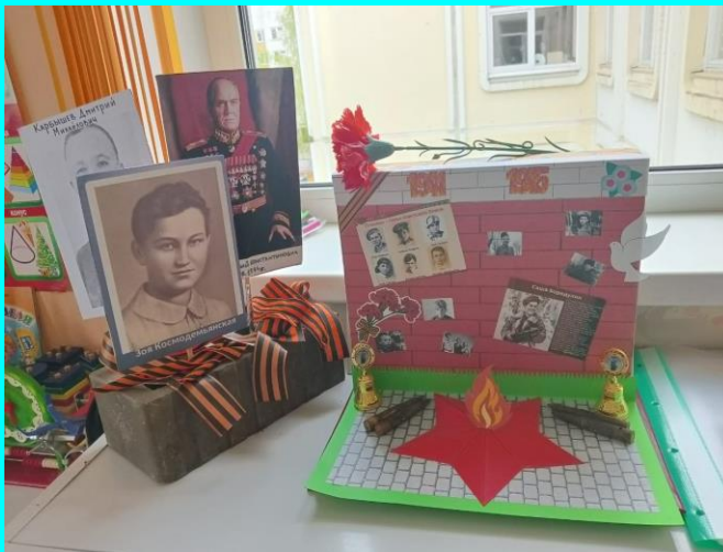
Оформлен макет вечного огня, для возложения цветов.